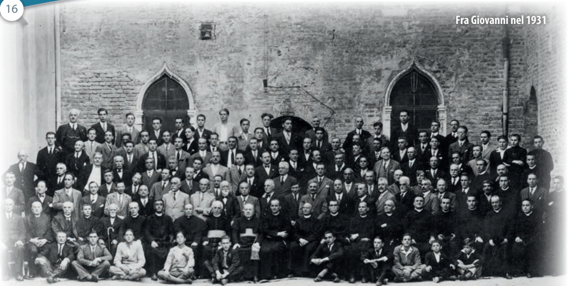
Il Ricordo del I centenario dalla fondazione dei Canossiani Gruppo dei Confratelli anziani dell'Oratorio di S. Giobbe (Venezia) 27 - Settembre 1931