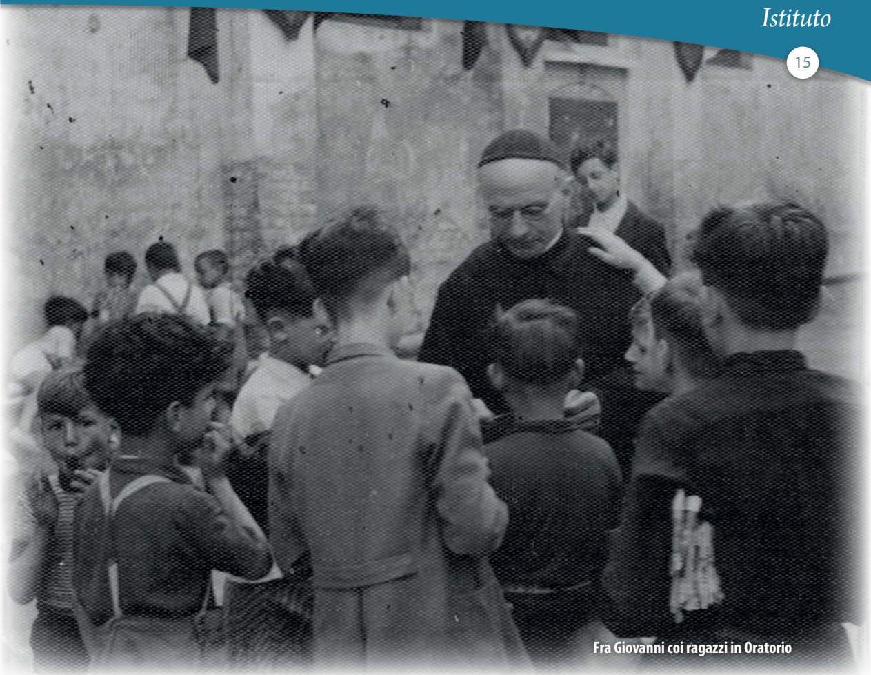
Fra Giovanni coi ragazzi in Oratorio