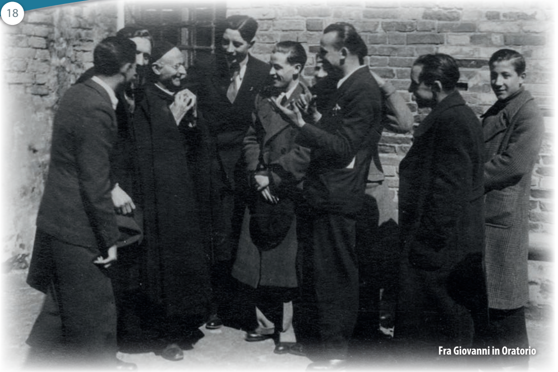
Fra Giovanni in Oratorio

era ragazzo e poi che Fra Benedetto Belloni aveva esultato alla ordinazione del De Levis, prevedendo che i Canossiani sarebbero stati tanti, sacerdoti e fra-telli e avrebbero avuto in cura anche la Chiesa di San Giobbe.